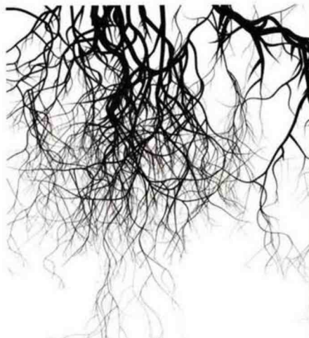
Mounir Fatmi - Sans titre (Racines) - 2016

« Nous éliminons une candidature sur deux » assume C. Phal. Le nouveau comité de sélection, septuor de maîtres du dessin, statue sur plus de cent cinquante dossiers, afin de choisir quelque soixante-dix galeries internationales. La présence française est, très volon-