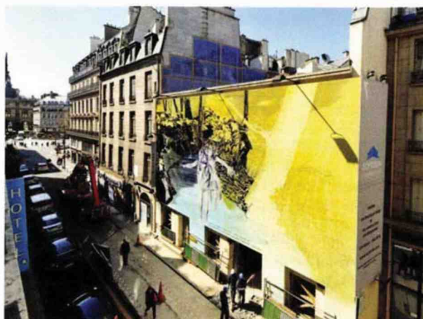
Ci-dessus, de gauche à droite, deux œuvres présentées à Drawing Now en 2017 : R. Lericolais (Sans titre – 2015 – Collage sur papier – Photo R. Lericolais/Nosbaum Reding) et A. Raffray (Les Brigades du Tigre Saison 2 – 1975 – Gouache sur carton – 31 x 46 cm – Galerie Semiose, Paris – Photo A. Mole). Dessous : le Drawing Hôtel en chantier. Et ci-dessous : C. Phal